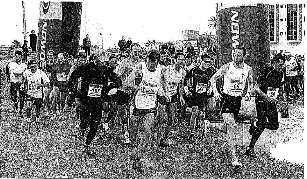
Los 300 atletas participantes tomaron la salida en las inmediaciones de la Ciudad Deportiva de Los Angeles. RAFAEL GONZÁLEZ