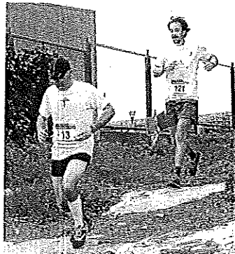
Los atletas, afrontando la recta final.